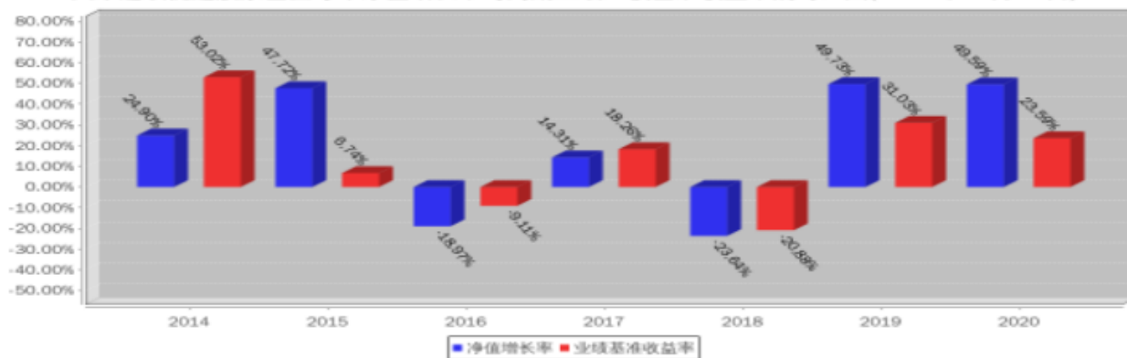
大摩进取优选股票基金每年净值增长率与同期业绩比较基准收益率的对比图(2020年12月31日)